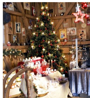
Lichterglanz im Kramer-Stodl